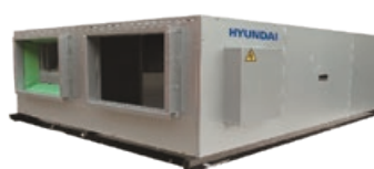
HRS: 1500~3000m 3 /h